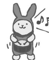
法政大学マスコット「えこぴょん」